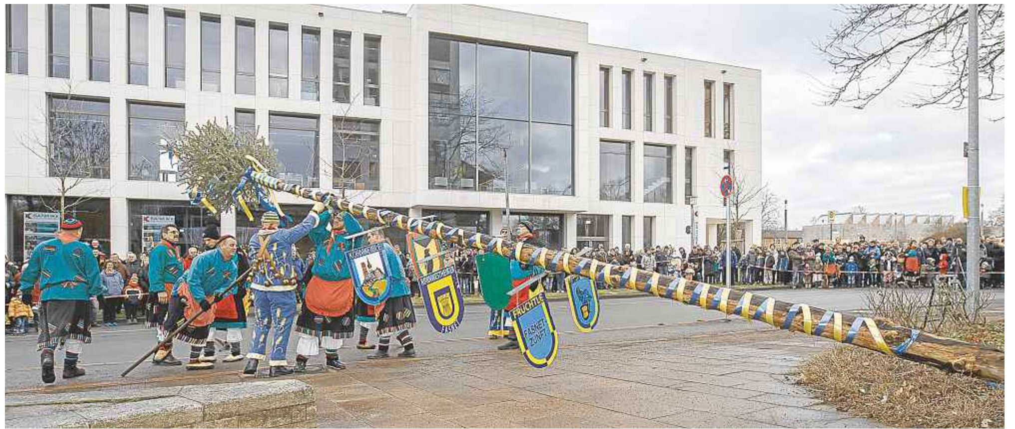
Mit vereinten Kräften wird der Narrenbaum vor dem Rathaus gestellt. Hunderte Zuschauer verfolgen das Spektakel.

Stoffreste sind vorhanden und werden kostenlos zur Verfügung gestellt. Auch Nähanfänger sowie Gäste sind willkommen. (red)